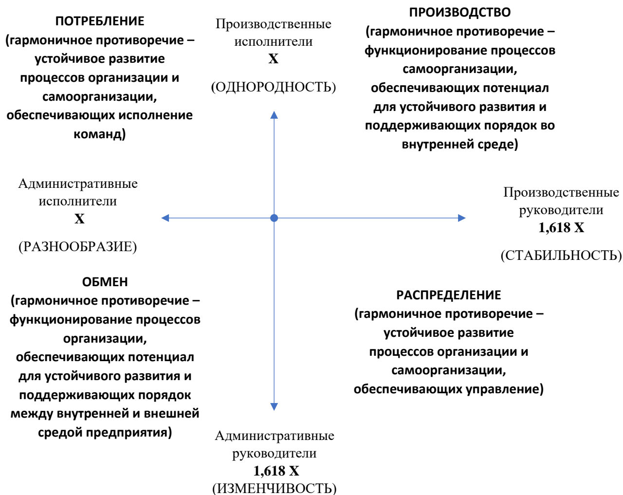
Рисунок 3 – Гармоничная структура временного (нематериального) ресурса сложноорганического противоречия, составляющего предприятие